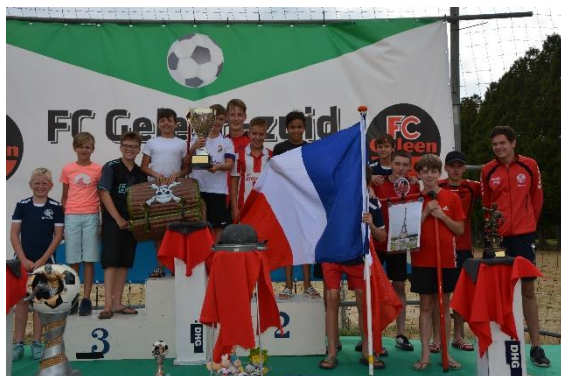
Vive la France!

De Fair Play Cup van woensdag is naar team Frankrijk gegaan! Ze hebben een heel leuke kleedkamer en zelfs zelf schilderijen gemaakt. Een mooie aankleding, waarin aan wijn en stokbrood is gedacht. Félicitations!